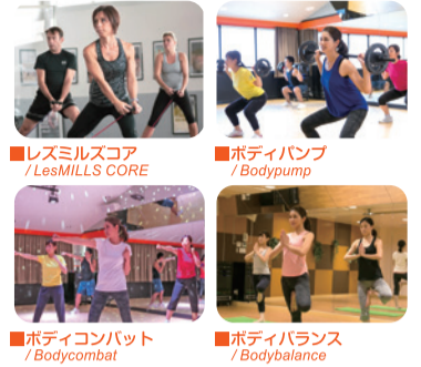
■レスミルスコア / LesMILLS CORE ■ボディパンプ / Bodypump ■ボディコンバット / Bodycombat ■ボディバランス / Bodybalance