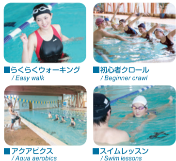
■らくらくウォーキング / Easy walk ■初心者クロール / Beginner crawl ■アクアエアロビクス / Aqua aerobics ■スイムレッスン / Swim lessons