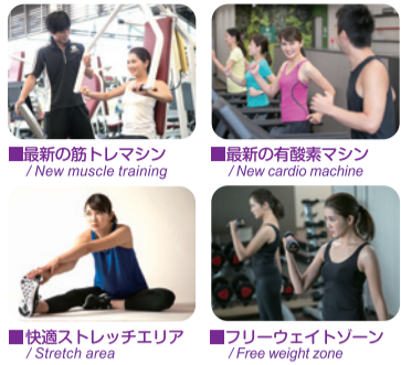
■最新の筋トレマシン / New muscle training ■最新の有酸素マシン / New cardio machine ■快適ストレッチエリア / Stretch area ■フリーウェイトゾーン / Free weight zone