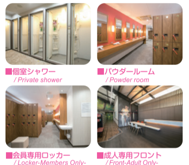
■個室シャワー / Private shower ■パウダールーム / Powder room ■会員専用ロッカー / Locker-Members Only ■成人専用フロント / Front-Adult Only