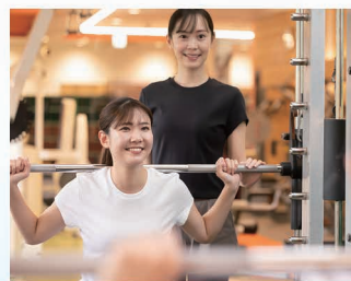
パーソナル トレーニング PERSONAL TRAINING