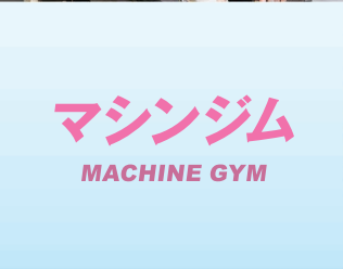
マシンジム MACHINE GYM