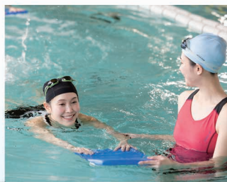
ウォーキング & ランニング WALKING & RUNNING