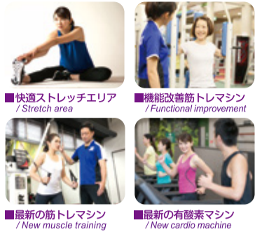
■快適ストレッチエリア / Stretch area ■機能改善筋力トレマシン / Functional improvement ■最新の筋力トレマシン / New muscle training ■最新の有酸素マシン / New cardio machine