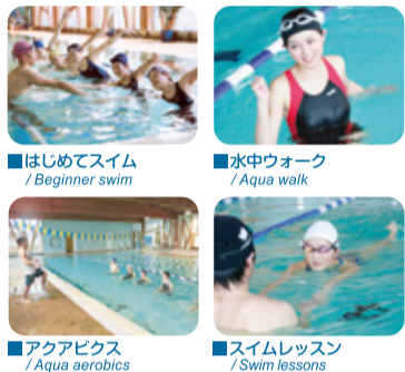
■はじめてスイム / Beginner swim ■水中ウォーク / Aqua walk ■アクアエアロビクス / Aqua aerobics ■スイムレッスン / Swim lessons