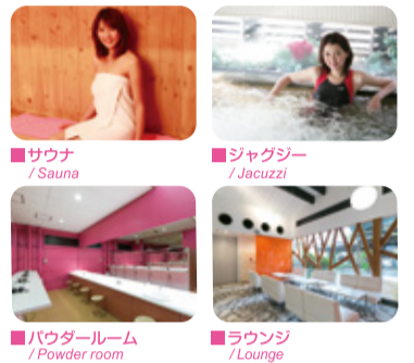
■サウナ / Sauna ■ジャグジー / Jacuzzi ■パウダールーム / Powder room ■ラウンジ / Lounge