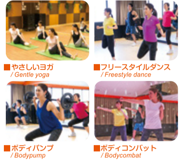
■やさしいヨガ / Gentle yoga ■フリースタイルダンス / Freestyle dance ■ボディパンプ / Bodypump ■ボディコンバット / Bodycombat