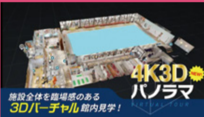
施設全体を臨場感のある 3Dバーチャル館内見学!