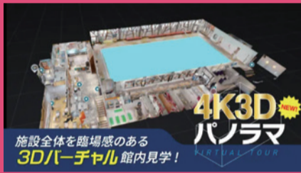
施設全体を臨場感のある 3Dバーチャル館内見学! 4K3D パノラマ