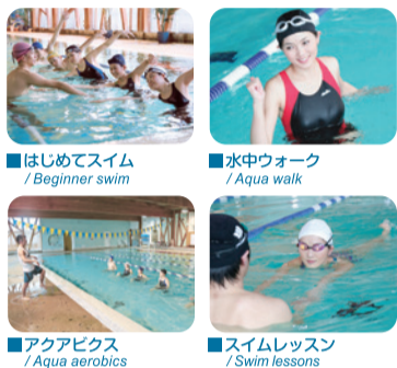
■はじめてスイム / Beginner swim ■水中ウォーク / Aqua walk ■アクアエクサ / Aqua aerobics ■スイムレッスン / Swim lessons