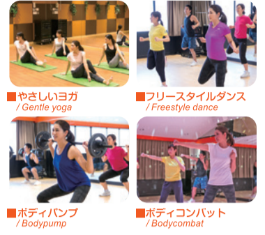
■やさしいヨガ / Gentle yoga ■フリースタイルダンス / Freestyle dance ■ボディパンプ / Bodypump ■ボディコンバット / Bodycombat