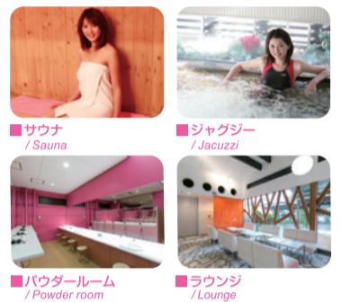
■サウナ / Sauna ■ジャグジー / Jacuzzi ■パウダールーム / Powder room ■ラウンジ / Lounge