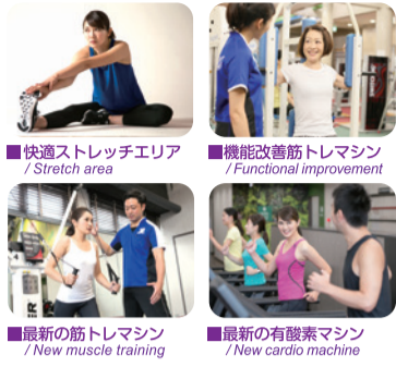
■快適ストレッチエリア / Stretch area ■機能改善筋トレマシン / Functional improvement ■最新の筋トレマシン / New muscle training ■最新の有酸素マシン / New cardio machine